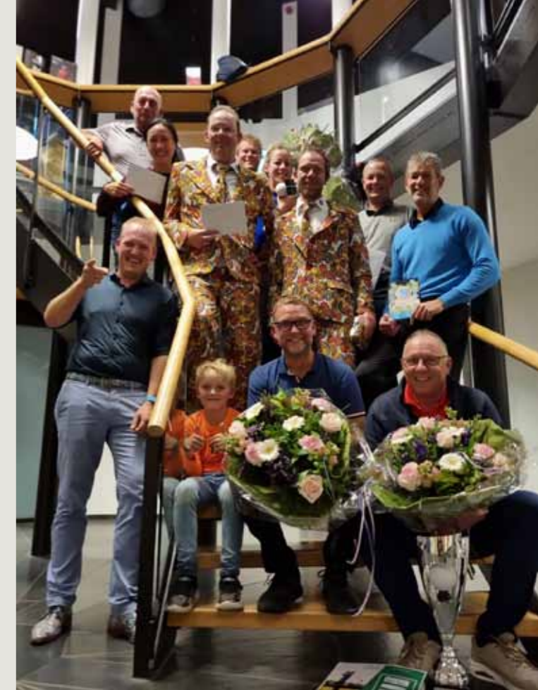
Het team IJssel Technologie is in een spannende strijd de winnaar van BusinessCup 2023 geworden. In 2022 waren er 40 deelnemers, in 2023 was dit aantal 80. Een geweldige prestatie derhalve van IJssel Technologie.

Beide spelers slaan af op elke hole, daarna kiezen ze een bal. De partner van de speler wiens bal gekozen is slaat de